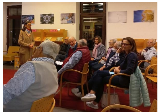
Rege Diskussion bei der Mitgliederversammlung 2021